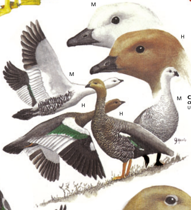
CAUQUÉN COMÚN Chloephaga picta Upland Goose