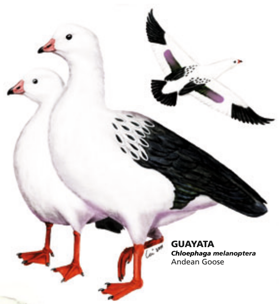
GUAYATA Chloephaga melanoptera Andean Goose