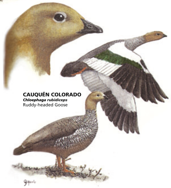
CAUQUÉN COLORADO Chloephaga rubidiceps Ruddy-headed Goose