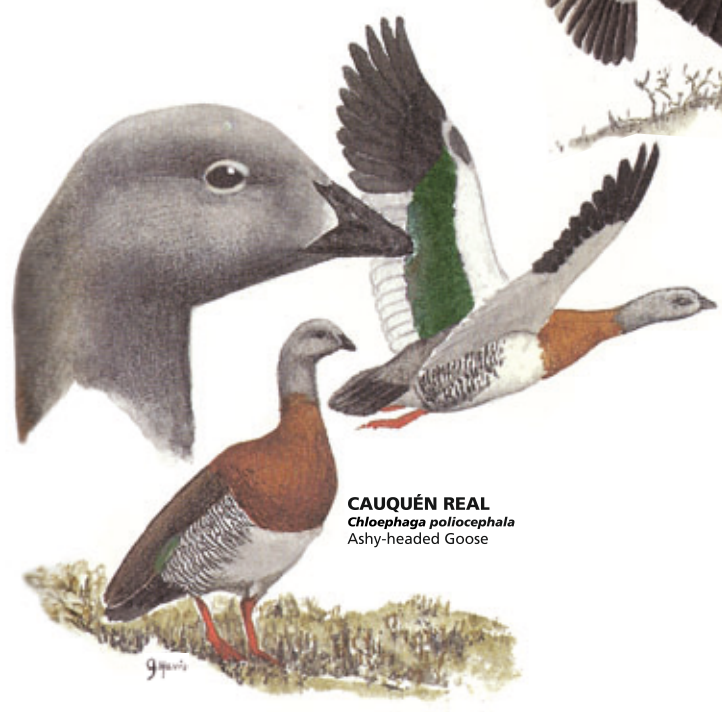
CAUQUÉN REAL Chloephaga poliocephala Ashy-headed Goose