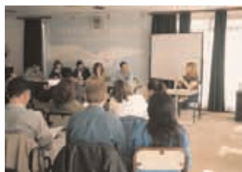
Puerto San Julián