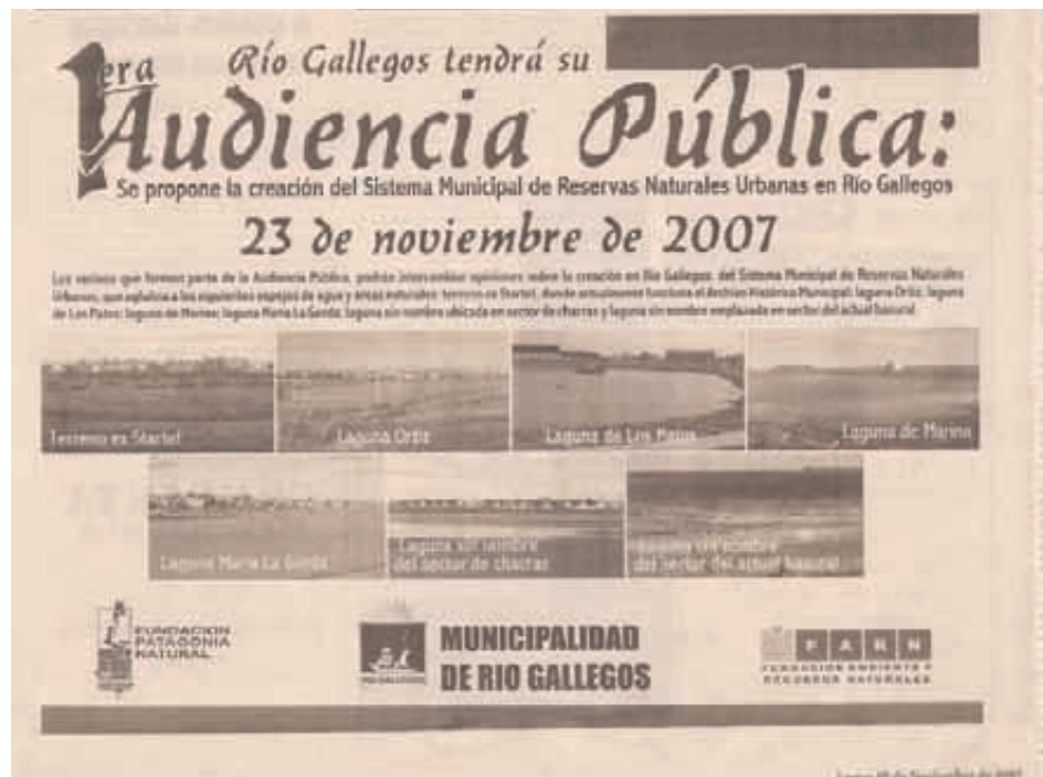
Publicidad en medios gráficos