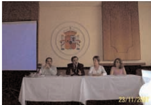
Autoridades y asesores. 20