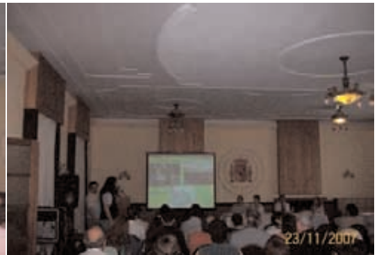
Presentaciones de expertos

- Se formularon varias preguntas por escrito que fueron respondidas por las personas a quienes le fueron formuladas.