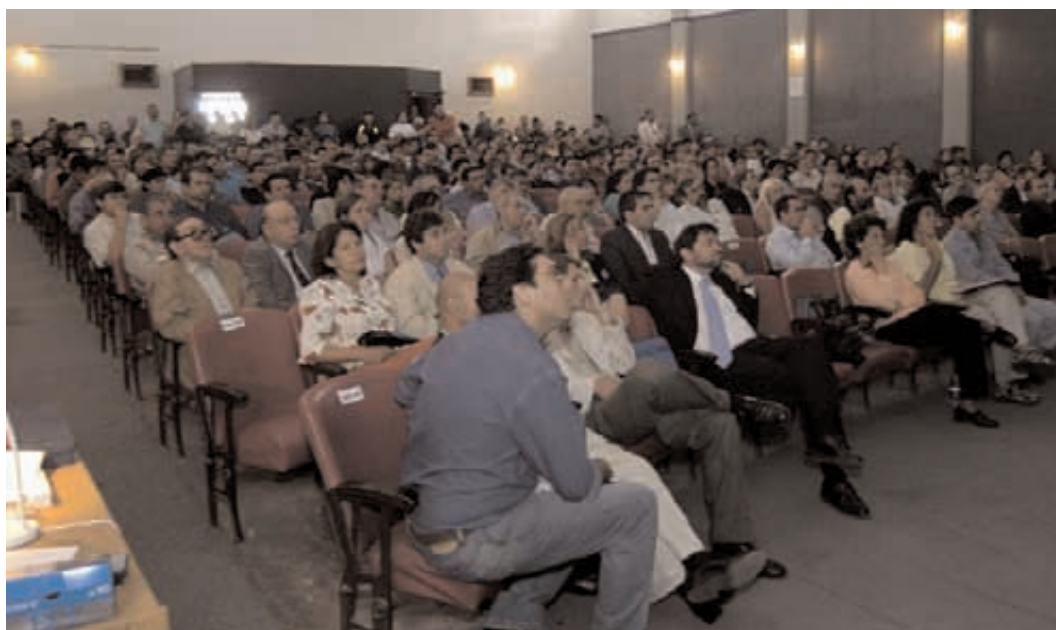
Público Presente en la Audiencia Pública 14