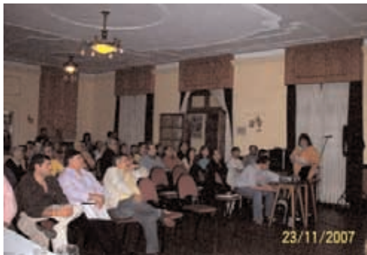
Presentación de los participantes.

- El presidente la Audiencia realizó el cierre del acto haciendo referencia a los próximos pasos a dar por el ejecutivo en relación a las opiniones vertidas durante su desarrollo.