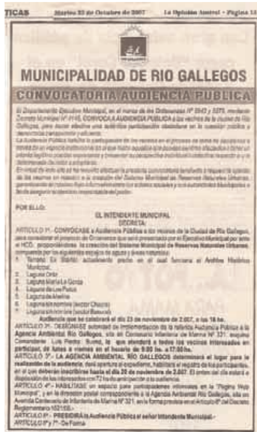
Convocatoria a Audiencia Pública