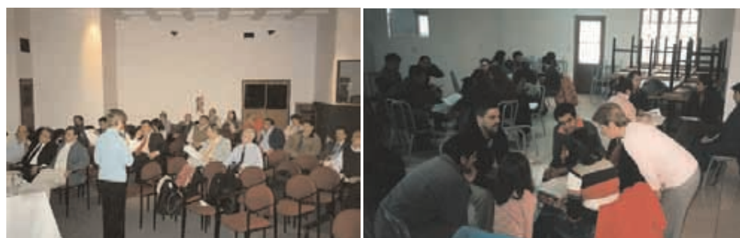
Taller con Funcionarios Municipales