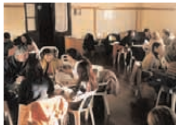
Puerto Santa Cruz