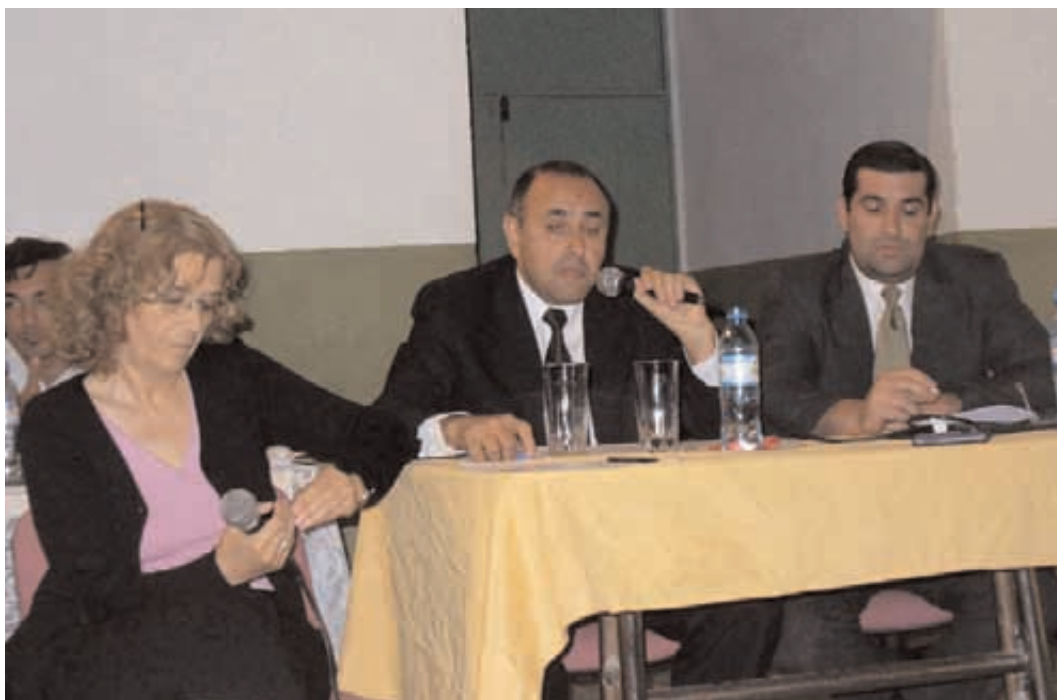
Autoridades de la Audiencia Pública 18