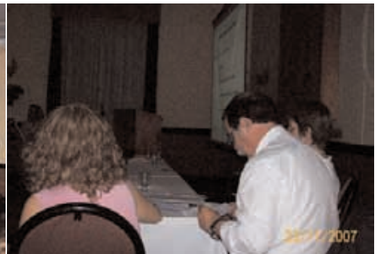
Espacio de preguntas.

- A las 21 hs y con una duración de 3 horas se dio por concluida la Audiencia Pública.