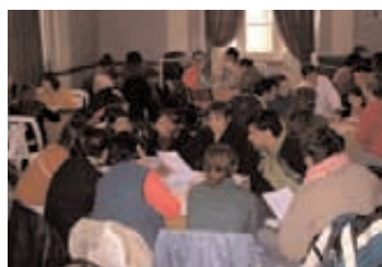
San Antonio Oeste