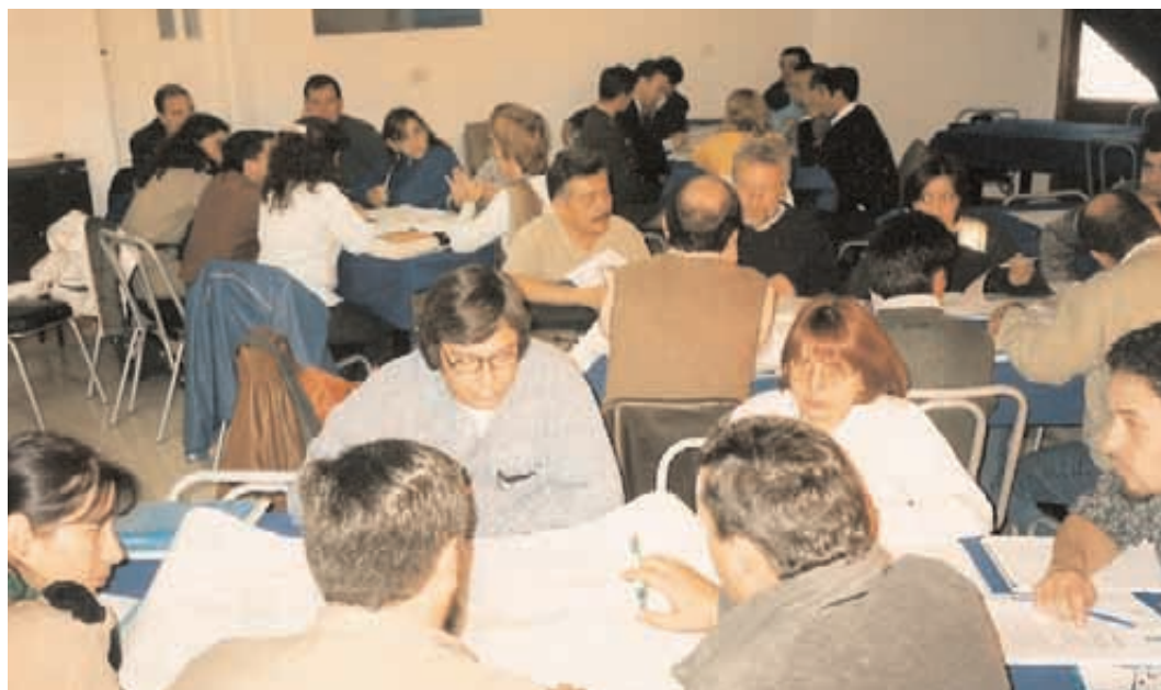
Taller sobre Mecanismos de Participación Pública del 17 al 19 /05705