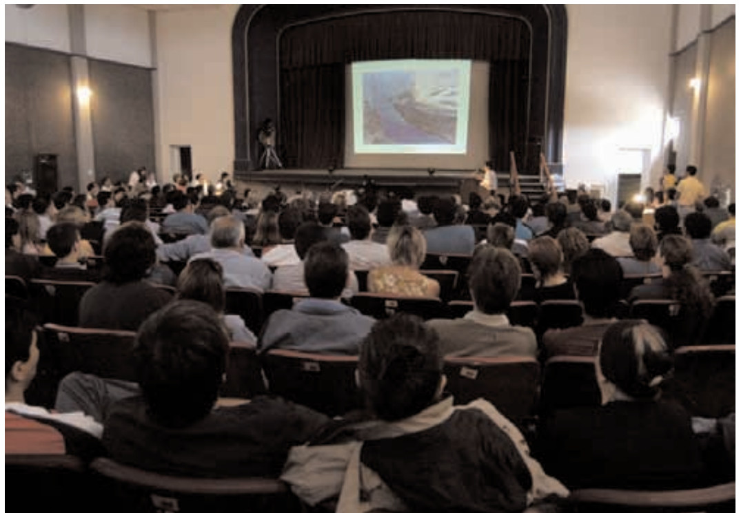
Desarrollo de la Audiencia Pública 15