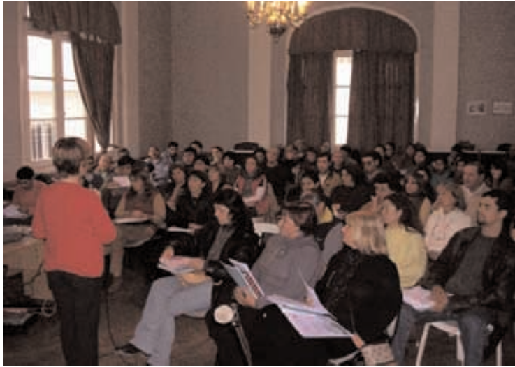
Taller sobre Mecanismos de Participación Pública 31/05 al 2/06/05

Durante el 2004 se desarrollaron una serie de reuniones multiactorales preparatorias para la puesta en marcha de la empresa, con presencia de los gobiernos provincial y municipal.