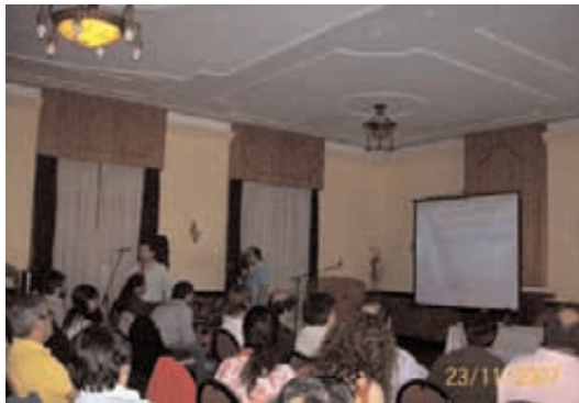
Presentación del proyecto