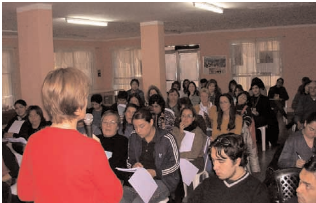
Taller sobre Mecanismos de Participación Pública 24 al 26/06/2004

Taller sobre Mecanismos de participación Pública ” realizado desde el 24 al 26 de Junio de 2004. Participaron 70 personas de diferentes sectores de la comunidad.