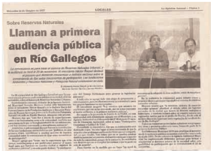
Nota sobre la convocatoria