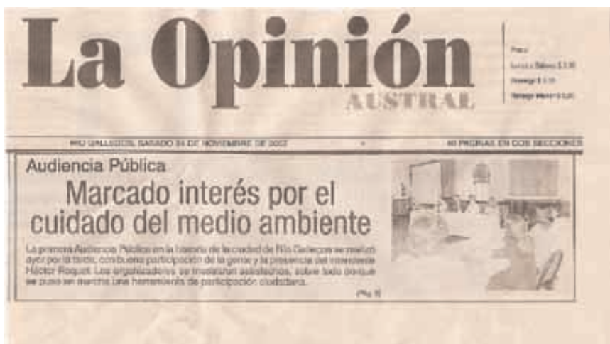
Notas en medios gráficos posteriores a la Audiencia Publica.